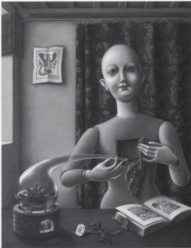
Essentia Exaltata, 2005